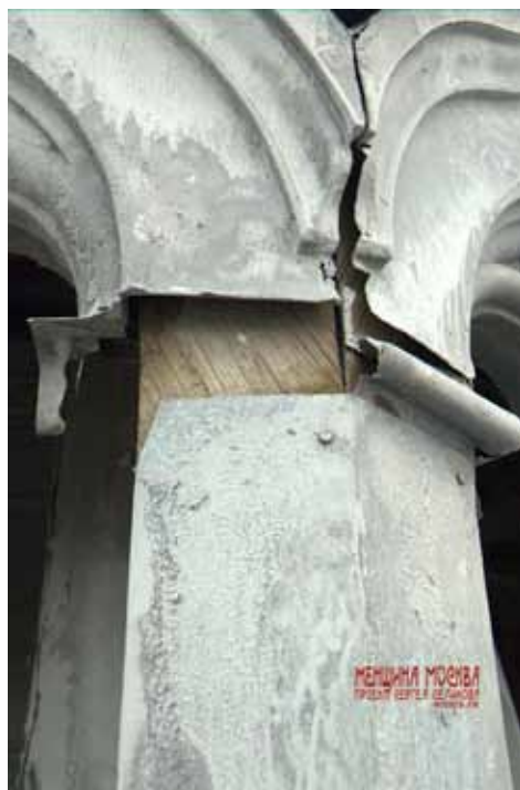
«Теремок» крупный план

Самая известная страховая компания Российской империи – страховое общество «Россия», было основано в марте 1881 г. Дом правления находился в С.-Петербурге на Морской улице. Главную ставку общество делало на страхование жизни, а не недвижимости, как большинство других страховых компаний. Основной капитал достигал 4 млн. рублей. Благодаря широкой рекламной кампании страховое общество «Россия» сразу же приобрело известность и популярность. Сделки заключались при помощи многочисленных агентов, разъезжавших по стране. Страховали даже стекла от разбития.