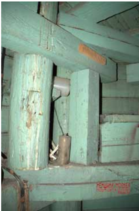
Чердак (за стеной башенные часы)

В башне со шпилем и под соседней скатной крышей в стиле русского терема (они расположены над фасадом,