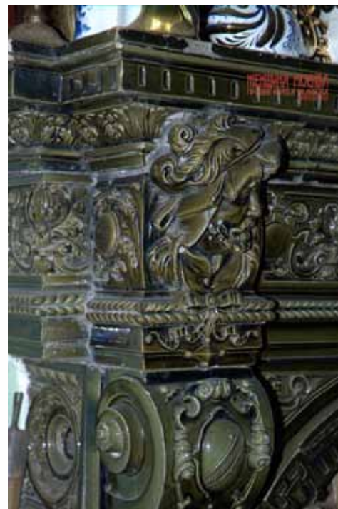
Камин (мастерская художника)

Камин в Доме не декоративные, как это часто бывало в постройках начала XX века (пример, особняк Петра Смирнова арх. Ф.О. Шехтель), а действующие. Камин и дымоходы до сих пор находятся в рабочем состоянии, но из соображений пожарной безопасности правление ТСЖ рекомендует жильцам не пользоваться ими. В квартирах есть и печи; они расположены не только в жилых комнатах, но и на кухнях ▶▶▶