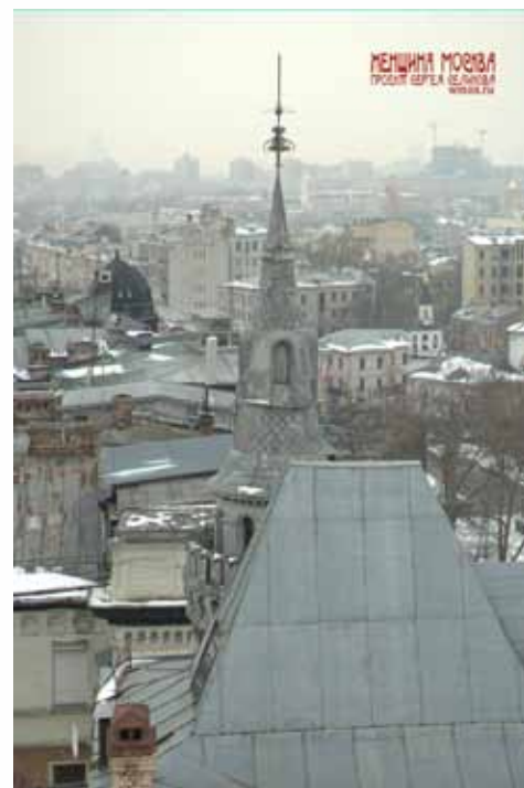
Вид на 2ю мансарду художника

Общество «Россия» осуществляло страховые операции и за границей: в Александрии, Афинах, Белграде, Константинополе, Нью-Йорке, Берлине и других городах. В конце 1918 г. размер капитала общества достигал 109,1 млн. руб.