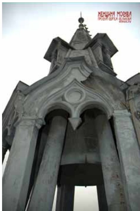
«Теремок» с колоколом

нью! С момента начала составления ведомости до момента получения из кассы прошло 22 дня и 3 часа. Дома - чисто. Ни куртки. Ни простынь. Ни книга».